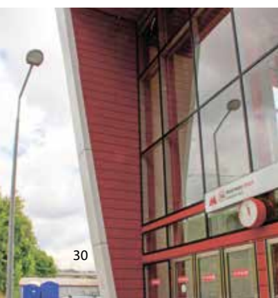
г.Нижнекамск, КГПТО ТАИФ НК