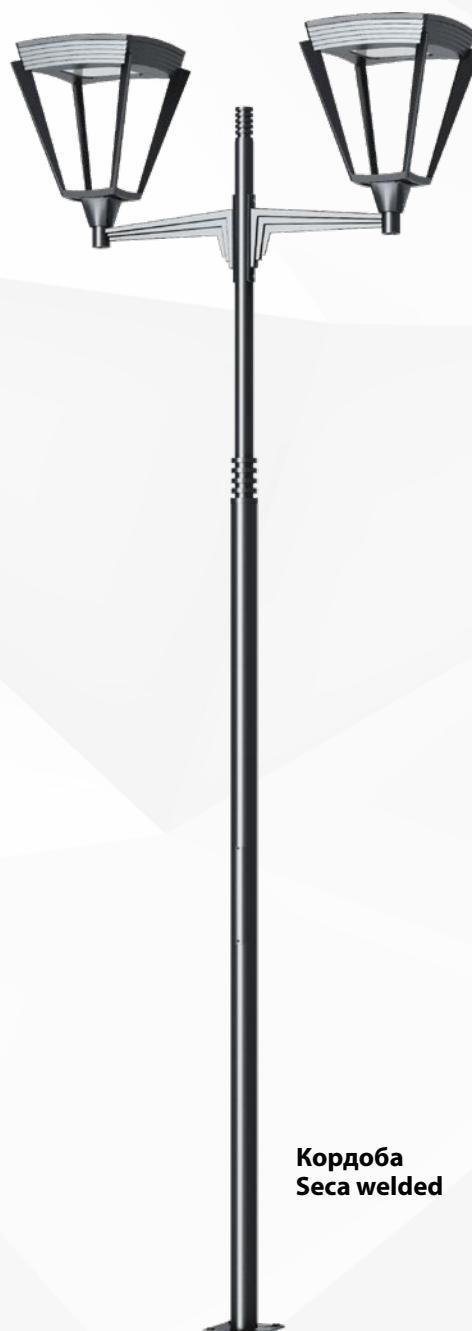
Кордоба Seca welded