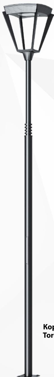
Кордоба Torde welded