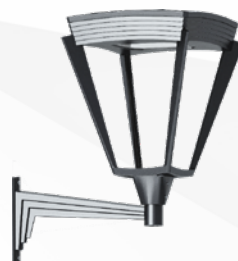
Кордоба Seca welded Комплект (светильник + кронштейн)