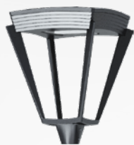
Кордоба Torde welded Светильник