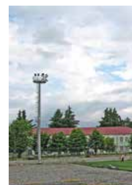
г. Москва, Красный Балтиец