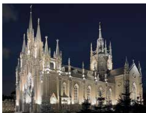
г. Москва, Собор Непорочного Зачатия Пресвятой Девы Марии